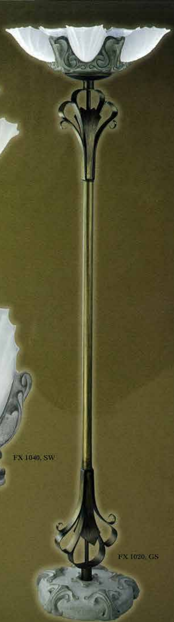
FX 1020, GS