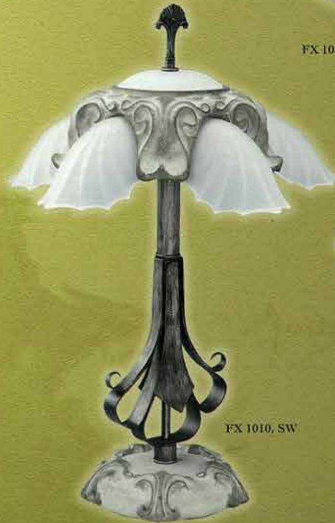
FX 1010, SW