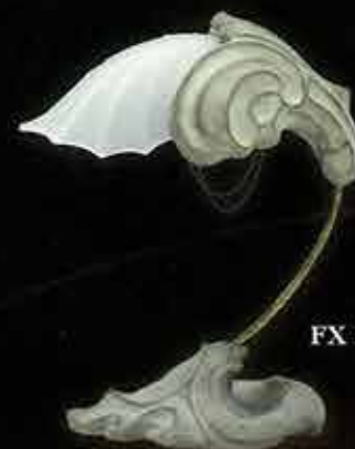
FX 1011, GS