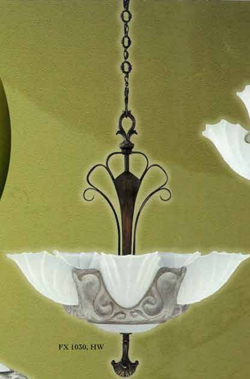
FX 1030, HW