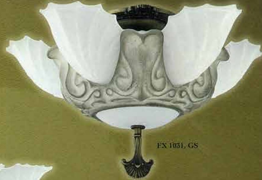
FX 1031, GS