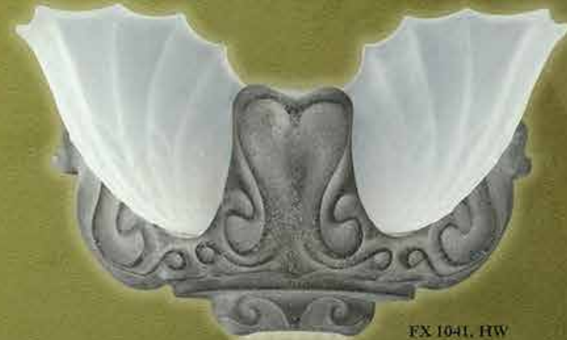
FX 1041, HW