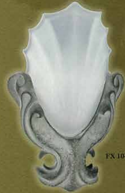
FX 1040, SW