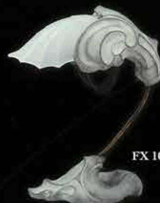
FX 1011, HW