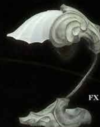
FX 1011, SW

A timeless and universal style that enhances the decor of both the nostalgic and the visionary.